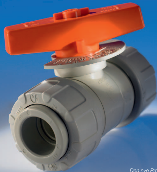
Den nye ProfiProp vandt Process Innovationsprisen 2009.

Det nye design af kuglen giver ventilen en helt unik lineær doseringskarakteristik. Ventilen kommer med et T-håndtag med en 0-90° positionsindikator i størrelser fra DN15 til DN50.