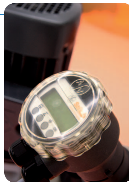
ASV ProPump med LCD display.

Efter et veloverstået første halvår hvor vi med spænding så hvilken indflydelse den generelle markedssituation ville få på vor virksomhed, kan vi med glæde konstatere at vor satsning på at styrke vor salgsorganisation, vores fokus på at komplettere produktprogrammet, samt overtagelsen af NovAseptic forhandlingen har været tilfredsstillende. Vi ser derfor med fortrøstning på den resterende del af 2009 og forventer et godt efterår.